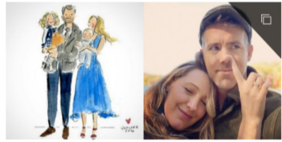
甜死了！當她說「I PICKED A GOOD ONE！」