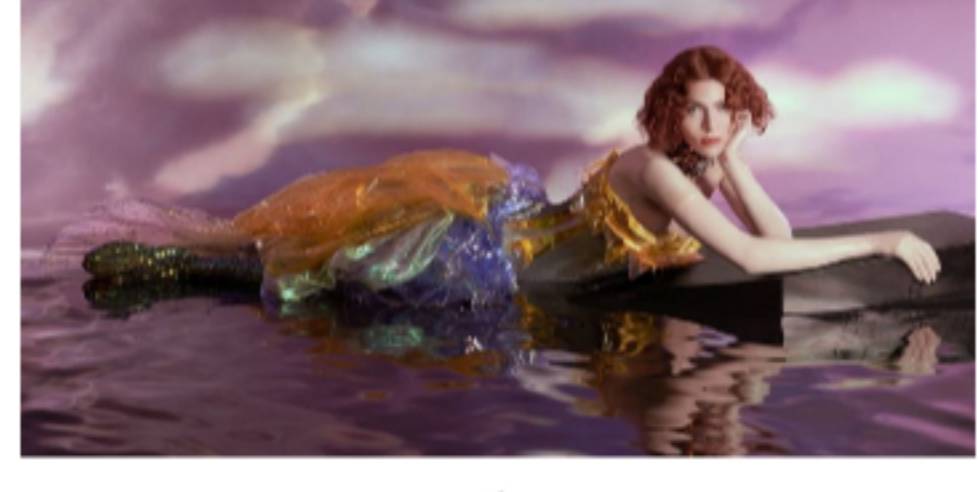
在巴黎時裝周占盡風頭的歌聲——跨性別藝術家Sophie Xeon