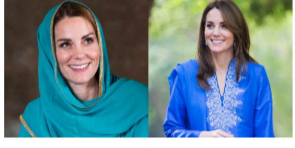
入境隨俗的最高境界！凱特王妃Kate Middleton出訪巴基斯坦穿搭特輯