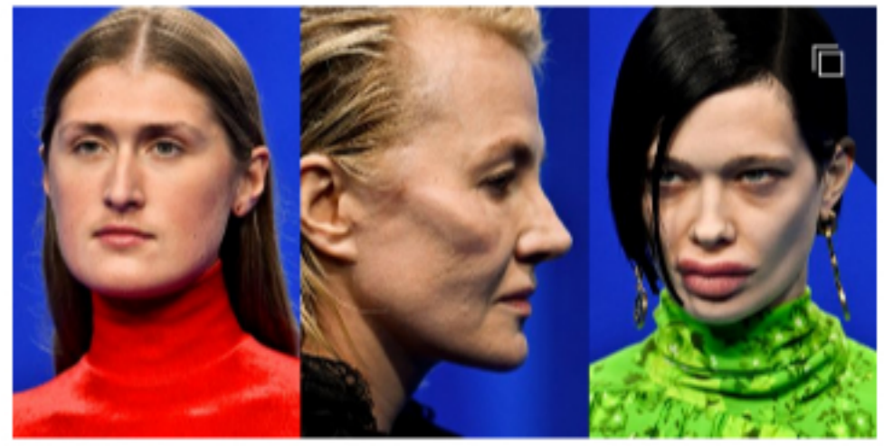
從BALENCIAGA選秀 看未來的「時尚臉」