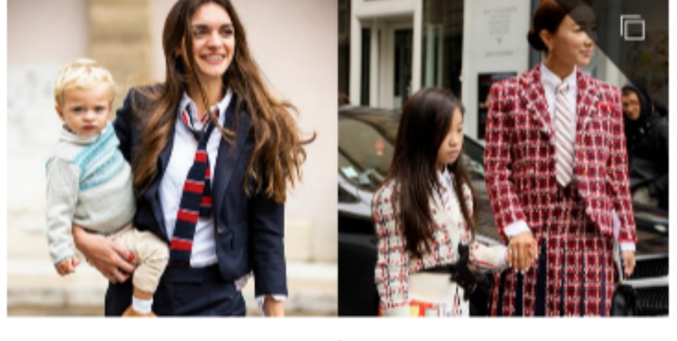
時髦媽媽怎麼穿？潮流指標THOM BROWNE來教妳