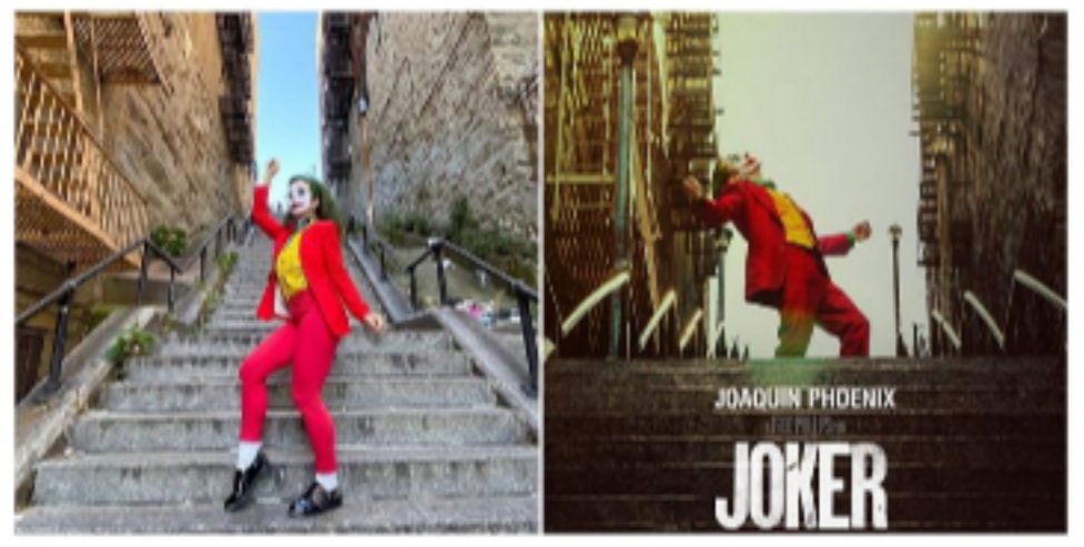
《小丑》一舞成名！紐約布朗區的「小丑階梯」成為時尚網美打卡新景點