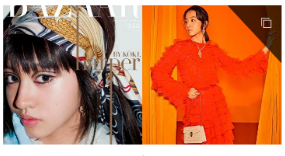
太美了！木村光希登上日本版 BAZAAR封面！