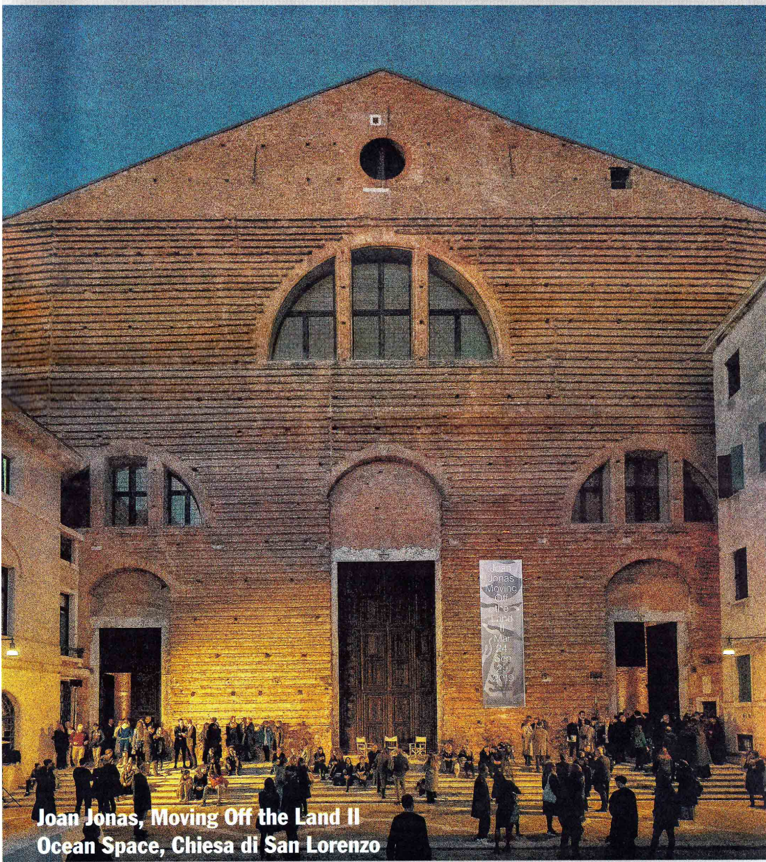
Joan Jonas, Moving Off the Land II Ocean Space, Chiesa di San Lorenzo

TUTTA L'ARTE DA VEDERE DA MAGGIO A NOVEMBRE