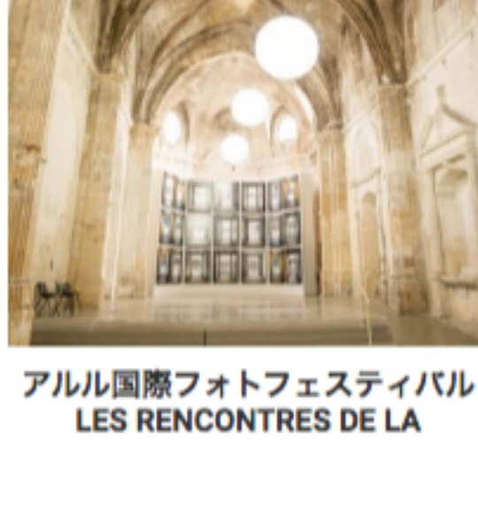
アルル国際フォトフェスティバル LES RENCONTRES DE LA